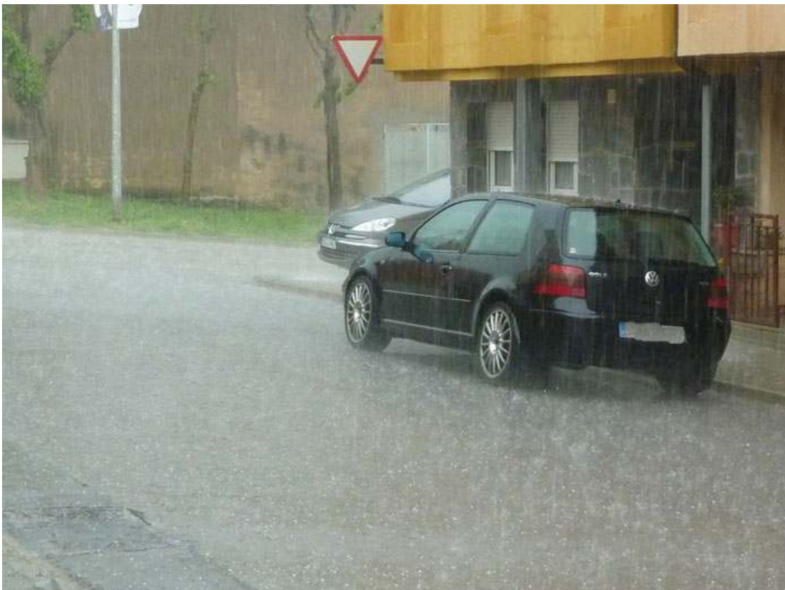
A la mateixa hora 14:28 T.U a Roda de Ter.