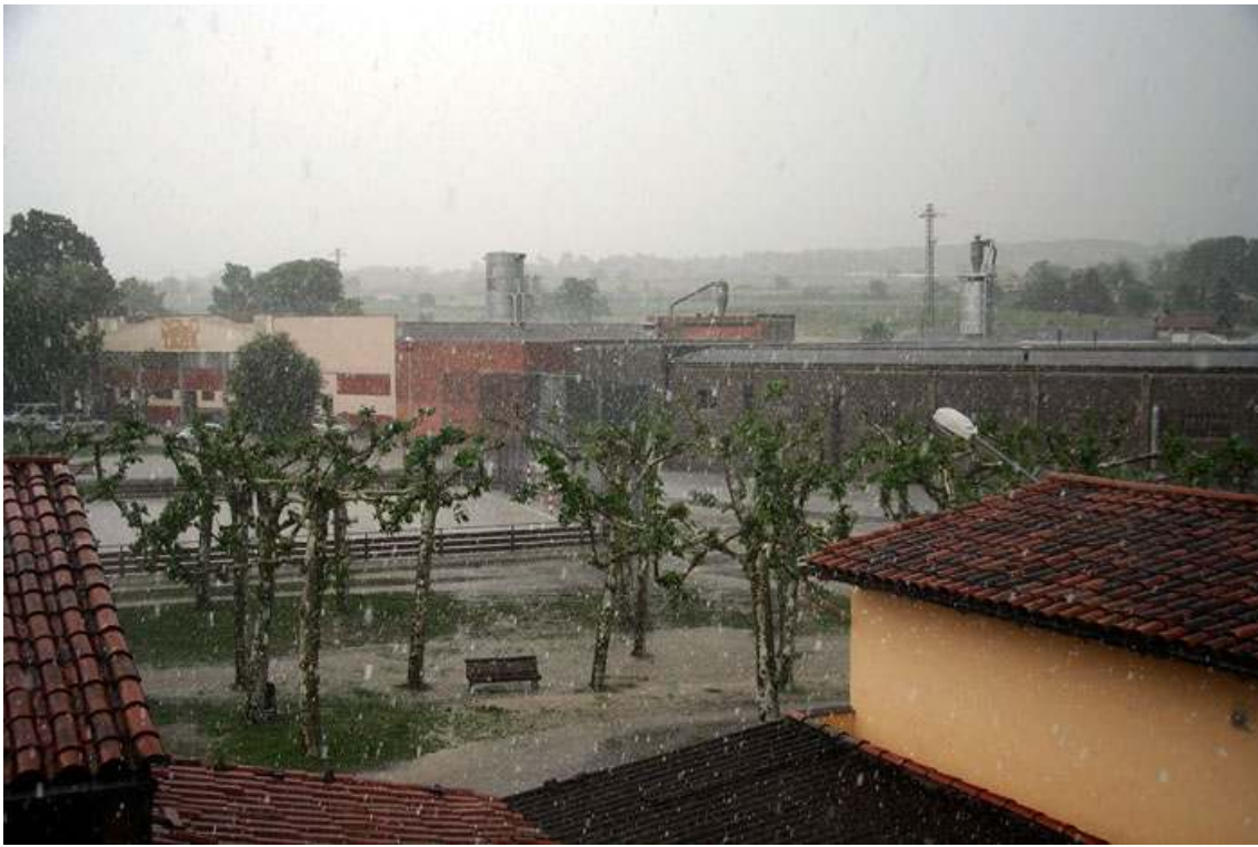
A les 14:28 h.T.U un aspecte de la calamarsa i la pluja que inundaven el parc a Les Masies de Roda.