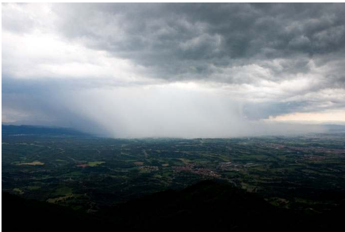
A les 14:25 h T.U el nucli tempestuós descarregant amb forta intensitat sobre Roda de Ter .