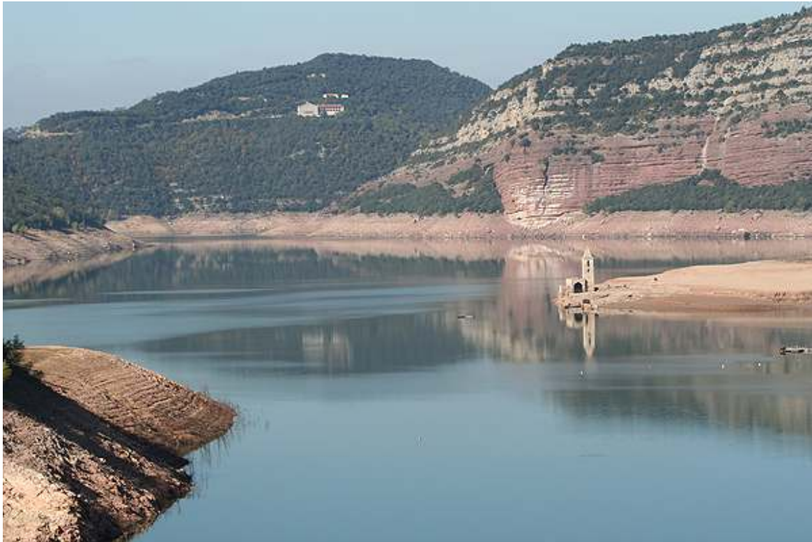
Baix nivell del Pantà de Sau a només el 29%.Per les mateixes dates l'any 2005 arribava al 18% 27 octubre 2007.